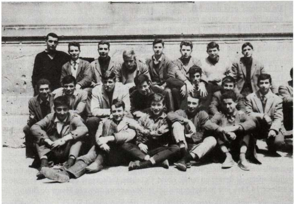
Lycée Henri IV (juin 1962)

Nous espérons que ce bilan rapide montrera aux anciens élèves auxquels il est destiné que leur collègue fait de son mieux pour offrir à ses élèves une formation de qualité et pour garder la bonne réputation qui a toujours été la sienne.