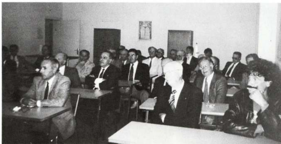
La réunion dans l'ancienne salle d'anglais du Collège.

La cérémonie prit fin et l'on se donna rendez-vous à vingt heures à la salle du restaurant du Château de MONBAZILLAC, pour un dîner dansant. C'est ainsi que cent dix joyeux convives, tout en dégustant un superbe Monbazillac en apéritif, écoutèrent avec attention les discours de Georges BRASSEM et de