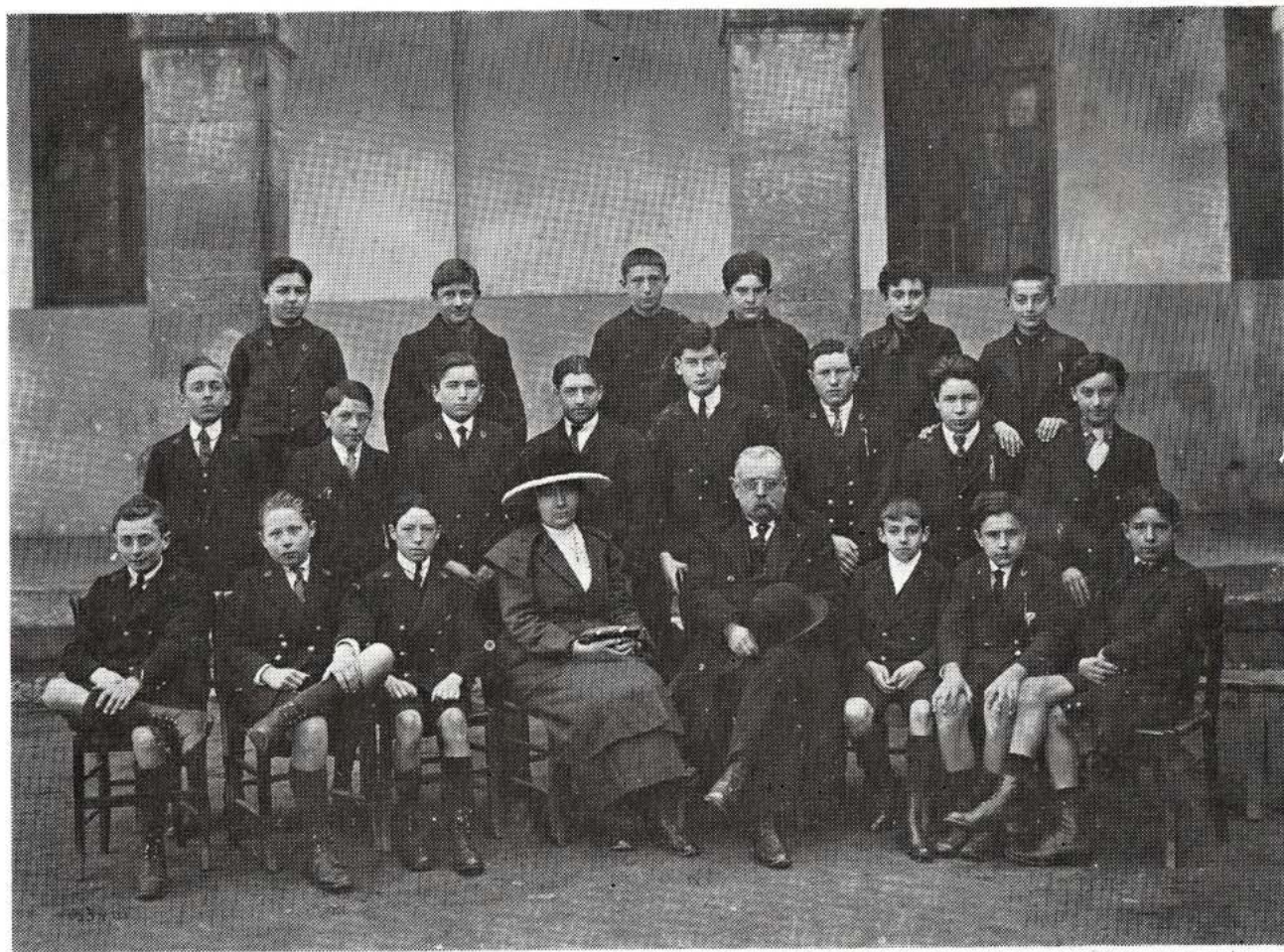
LA CLASSE DE 4 e A ET B EN 1920-1921